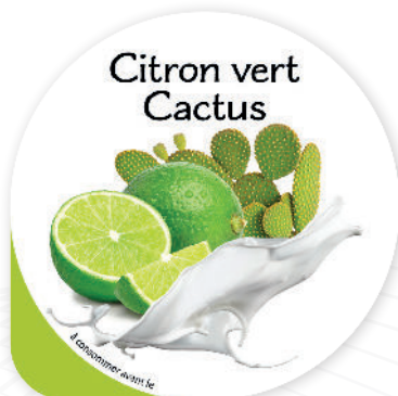
Citron vert Cactus