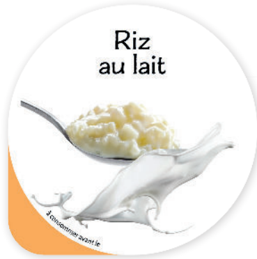
Riz au lait