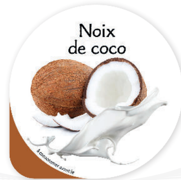
Noix de coco